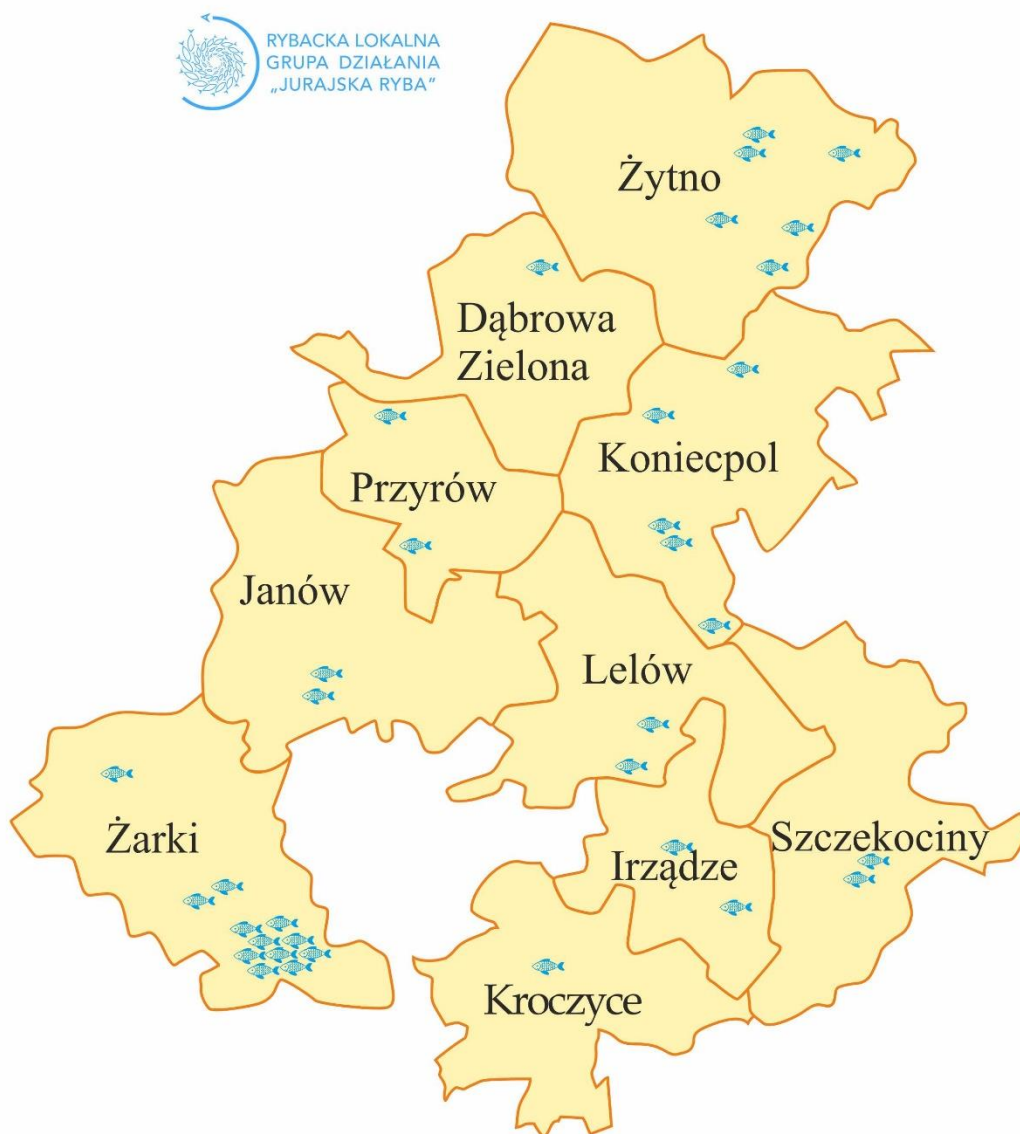
Rysunek 1. Mapa obszaru RLGD "Jurajska Ryba".